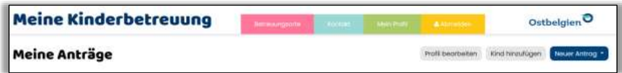
Abbildung 3: Funktionen im persönlichen Bereich