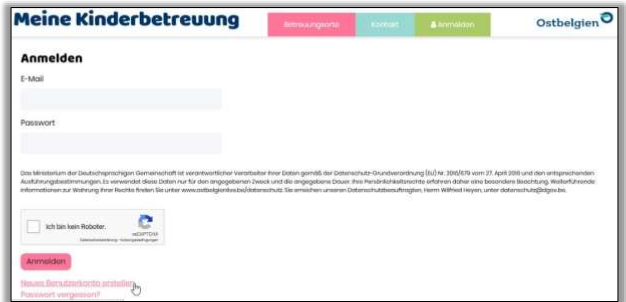
Abbildung 1: Anmeldeseite

Über die Schaltfläche „Anmelden“ und anschließend den Link „Neues Benutzerkonto erstellen“ kann ein eigenes Benutzerkonto erstellt werden: