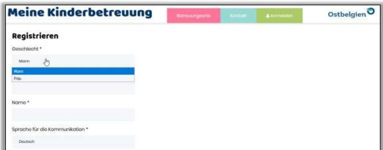
Abbildung 2: Erstellung eines neuen Benutzerkontos

Zur Erstellung dieses Benutzerkontos werden eine Reihe persönlicher Angaben abgefragt: