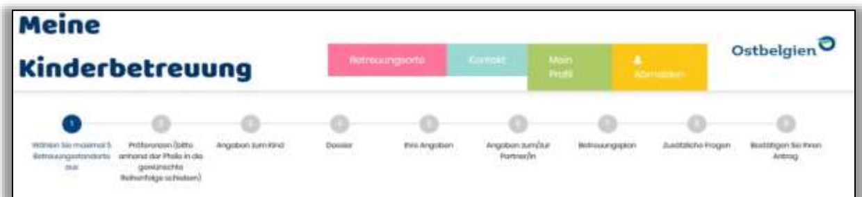
Abbildung 5: Verlauf bei der Erstellung eines neuen Antrages