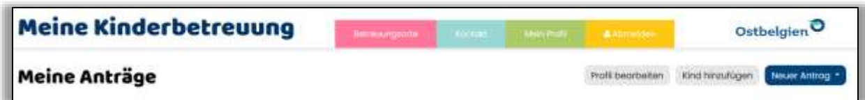
Abbildung 4: einen neuen Antrag stellen

Über die Schaltfläche „Neuer Antrag“ kann ein neuer Antrag erstellt werden: